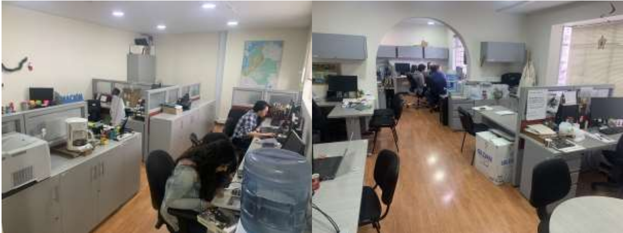
Programa de modelos de funcionamiento y programa de sostenibilidad e intervención

traslado de todos los equipos de cómputo y los especializados incluyendo un sistema de contención de lluvias (Etapa III ítems 4 y 5), con el fin de que no se genere ningún daño en los equipos y se presente la menor perturbación en las actividades del Instituto.