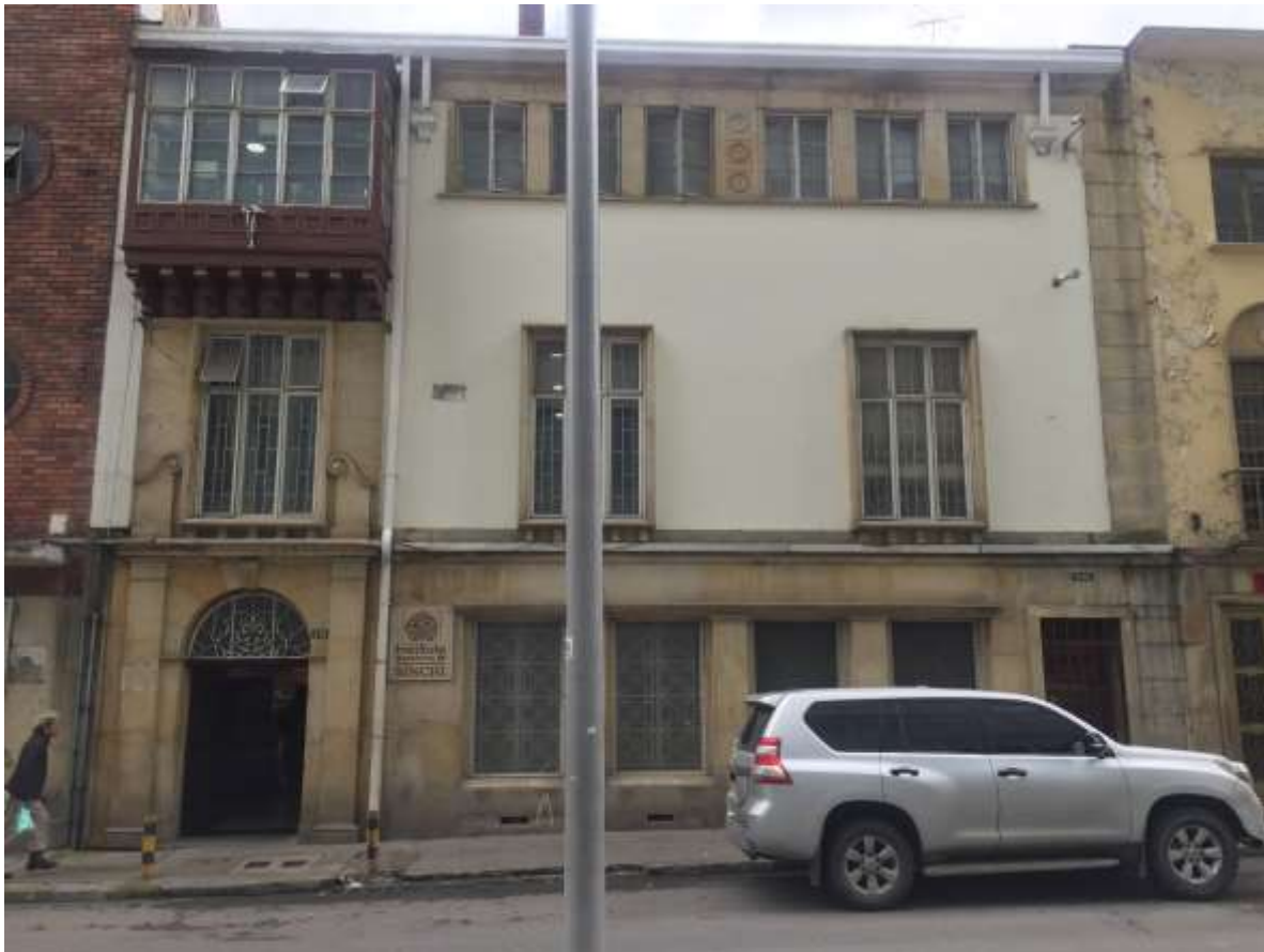
Frente de edificio sede enlace del Instituto Amazónico de Investigaciones Científicas Sinchi

La Zona A tiene 4 pisos de alto aproximadamente 12 a 15 metros de altura en cubiertas y la Zona B, tiene 3 pisos de alto aproximadamente 9 a 12 metros de altura en cubiertas.