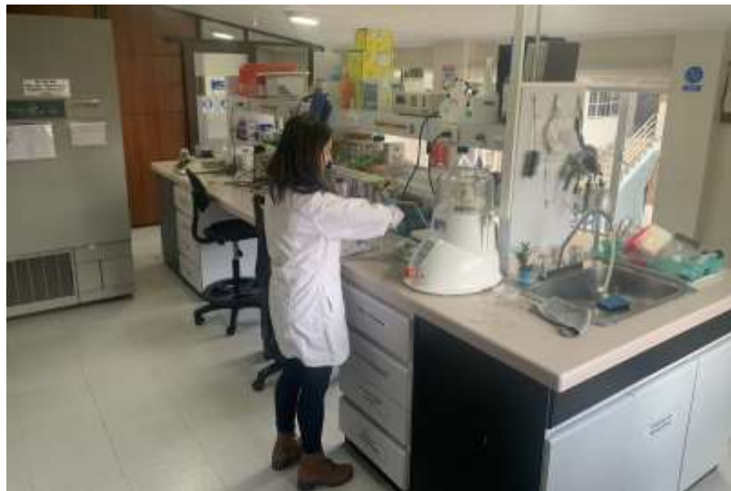
Laboratorio de Biotecnología y recursos genéticos

Directamente bajo las cubiertas de la Etapa III a intervenir se encuentra el programa de modelos de funcionamiento que maneja el Sistema de Información Geográfica, el laboratorio de herpetos y el programa de sostenibilidad e intervención, todos los cuales van a estar en funcionamiento durante el tiempo de ejecución del contrato. En razón a esto el contratista debe tener en cuenta el movimiento y