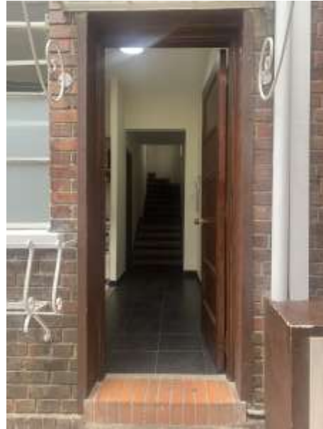
Acceso para ingreso de material en la Etapa I y II