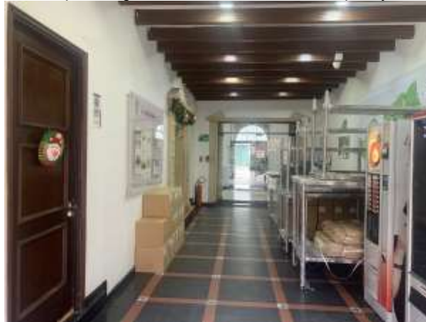
Acceso principal del Instituto

Al inicio de la ejecución de las obras se el interventor de la obra verificará en conjunto con el contratista el estado actual de los accesos y una vez finalizada toda la intervención el contratista garantizará que dejará todos los espacios y accesos en el mismo estado en que se encontraban al momento de iniciar.