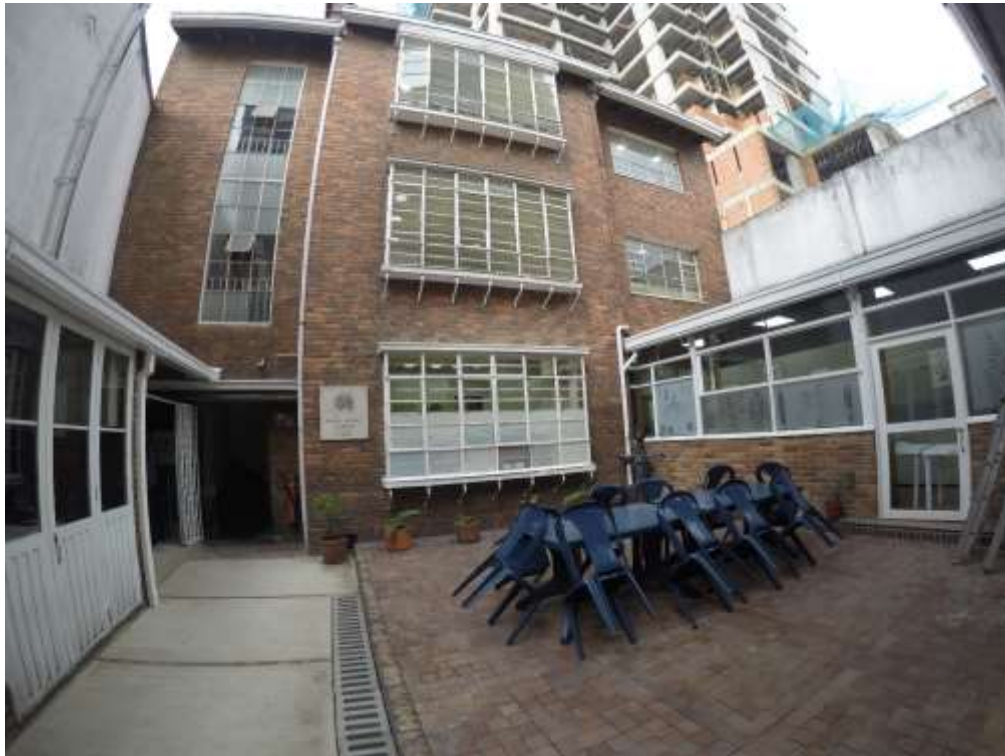
Edificación Zona B, edificación que se encuentra en la parte posterior del predio, con frente al patio central.

En la parte de atrás, se encuentra la edificación posterior o Zona B, que puede observarse en la siguiente fotografía y que cuenta únicamente con 3 pisos, donde también se tienen usos diferentes, en el primer piso el Herbario Amazónico Colombiano, y en el segundo y tercer piso, zonas de trabajo de los investigadores y algunos temas administrativos como control interno.